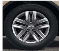
OPTIONAL ON ALL MODELS 19" 'Esperance' alloy wheels, 8.5J x 19 Tyres: 255/55 R19