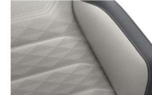
"Savona" leather Mistral/ Grigio (VD) Optional on all models