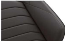
"Vienna" leather Soul (VM) Optional on all models