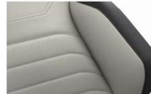
"Vienna" leather Mistral/ Grigio (VD) Optional on all models