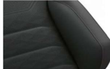
"Savona" leather Juniper/ Soul (YA) Optional on all models