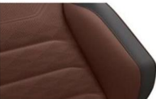
"Savona" leather Florence/Soul (YV) Optional on all models