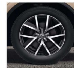
OPTIONAL ON ALL MODELS 20" 'Braga' alloy wheels, in 'Black' with diamond turned surface 9J x 20 Tyres: 285/45 R20