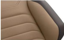
"Vienna" leather Atacama/Raven (YF) Optional on all models