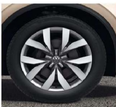
OPTIONAL ON ALL MODELS 20" 'Montero' alloy wheels in 'Glam Silver'