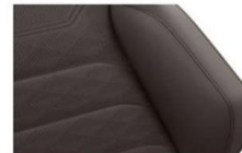
"Savona" leather Raven (VV) Optional on all models