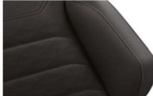
"Savona" leather Soul (VM) Optional on all models