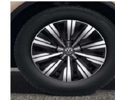
OPTIONAL ON ALL MODELS 19" 'Tirano' alloy wheels, with diamond turned surface 8.5J x 19 Tyres: 255/55 R19