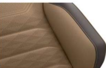
"Savona" leather Atacama/Raven (YF) Optional on all models