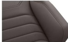
"Vienna" leather Raven (VV) Optional on all models