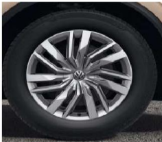
OPTIONAL ON ALL MODELS 19" 'Osorno' alloy wheels 8J x 19 Tyres: 255/55 R19