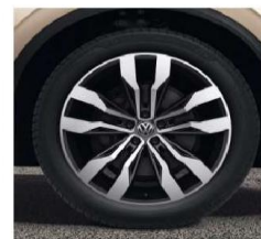
OPTIONAL ON ALL MODELS 21" 'Suzuka' alloy wheels 9.5J x 21 Tyres: 285/40 R21