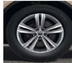
OPTIONAL ON ALL MODELS 19" 'Sebring' alloy wheels 8.5J x 19 Tyres: 255/55 R19