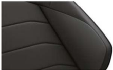
"Graphite" fabric Soul (VM) Standard on Touareg