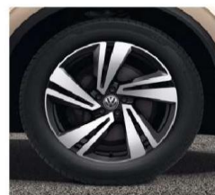
OPTIONAL ON ALL MODELS 20" 'Nevada' alloy wheels, in 'Black' with diamond turned surface 9J x 20 Tyres: 285/45 R20